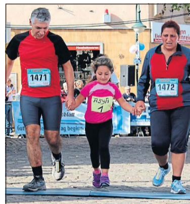
Dabei sein ist alles – gerne auch als Familie: Vater, Mutter und Kind als Siegertypen.